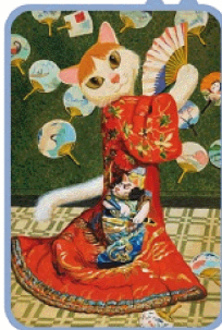
《穿和服的卡貓兒》喵內

《貓·美術館》特展，展品內容多為西洋美術史上重要的世界名畫，在山本修Shu Yamamoto 藝術創作的帶領下，透過討喜可愛的貓世界來呈現名畫，達到寓教於樂、拉近民眾與藝術的距離！本次展覽將以五大區呈現豐富多元的貓藝術，共展出60件作品，可飽覽東西方貓大師的曠世傑作。